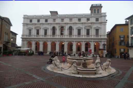
Bergamo - Centro