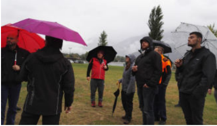
auch der hat geendet und wer sagt