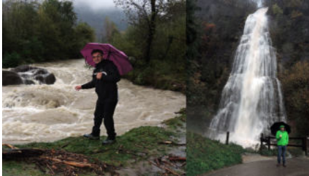
2018 „der jahrhundert“ Regen aber